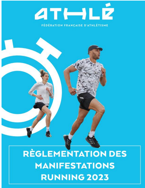
La réglementation des manifestations